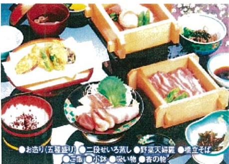
お造りとせいろ蒸し膳 イメージ