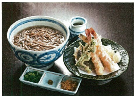
天ぷら釜揚げそば イメージ

ご旅行日 2019 11月23日 (祝土) 旅行代金 12,800円 子供 -1,800円引き