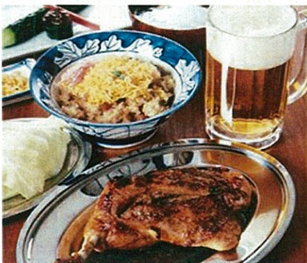
讃岐名物骨付鶏の一鶴 オプションイメージ

ご旅行日 2019 12月15日(日) 旅行代金 8,800円 子供 -800円引き